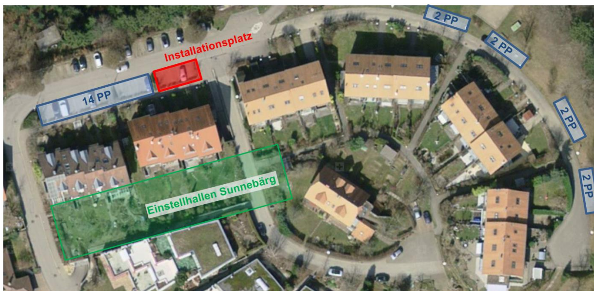
Abbildung Standorte Ersatzparkplätze

Die Instandsetzungsarbeiten werden in vier Bauphasen a zwei Wochen durchgeführt. Während dieser Bauphase sind die in der Beilage aufgeführten Parkplatzbereiche gesperrt und die betroffenen Fahrzeuge müssen ausserhalb auf den vorgesehenen Ersatzparkplätzen abgestellt werden.